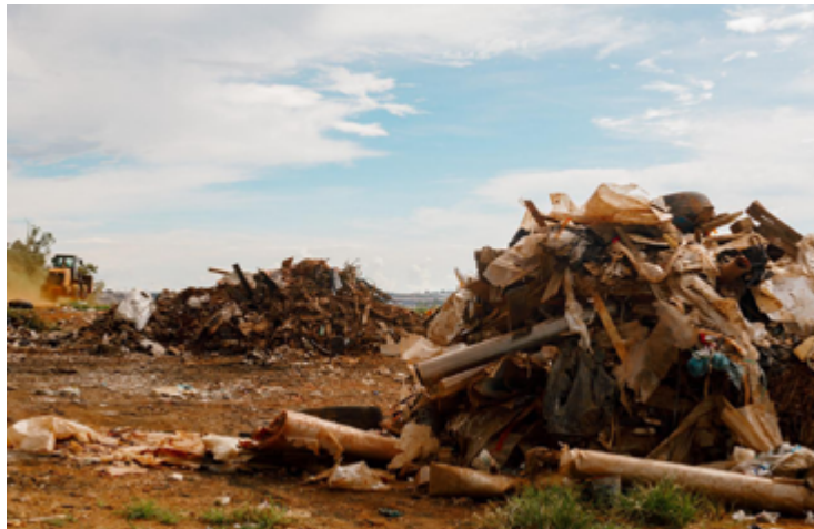
Lotes com mato alto e sujo são responsabilidades dos proprietários, mas, situações que provocam, geram problema para toda comunidade

O gerente de Postura apela para a conscientização dos anapolinos. “É fundamental que a população se atente quanto à importância em manter seus imóveis devidamente limpos, e assim evitar uma doença que só em 2024 foi responsável por quase 400 mortes no país”, reforça o profissional. O Aedes aegypti , que causa a dengue,