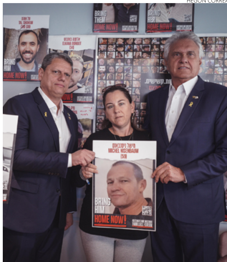
Ronaldo Caiado e Tarcísio de Freitas prestam solidariedade à família de cidadão brasileiro-israelense mantido refém pelo Hamas: “estarrecedor ver a alegria dos terroristas em matar e mutilar”

Ainda ontem, Caiado visitou Indústrias Aeroespaciais Israelenses (IAI), cuja missão é desenvolver tecnologia nos setores de defesa, aeroespacial e comercial.