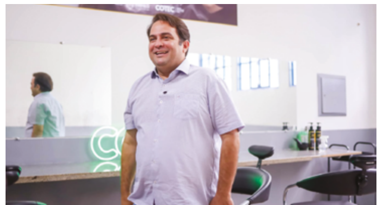
Prefeito Roberto Naves destaca atuação do CEITec na qualificação de trabalhadores para ocupar vagas de trabalho com carteira assinada

Nos próximos meses, a geração de empregos receberá um impulso ainda maior com a abertura do Politec, primeiro distrito industrial municipal, e a expansão do Distrito Agroindustrial de Anápolis (Daia), numa área de 1,7 milhão de metros quadrados, será destravada pelo governador Ronaldo Caiado, atendendo a um pedido antigo do prefeito. No primeiro mês de 2024, Anápolis teve 5.829 contratações e 4.793 demissões no mercado formal, saldo positivo de 1.036 vagas. No ano passado, abriu 4.954 postos de trabalho com carteira assinada.