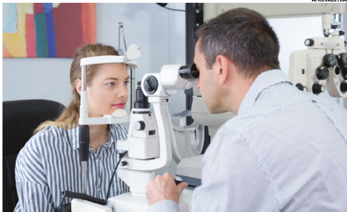
Com reforma no Código Brasileiro de Trânsito, 144 médicos devem perder credenciamento em 12 de abril

Atualmente, Goiás conta com 498 médicos de trânsito creden-