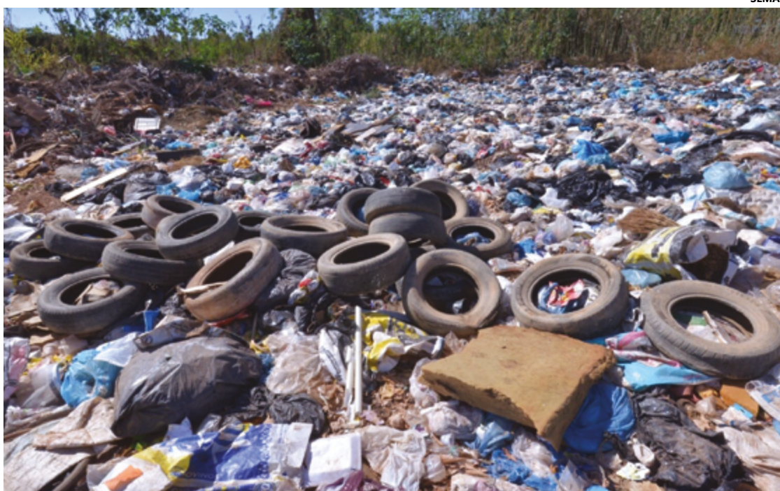
Goiás enfrenta a situação crítica de 186 lixões ativos, principal destino inadequado de resíduos sólidos