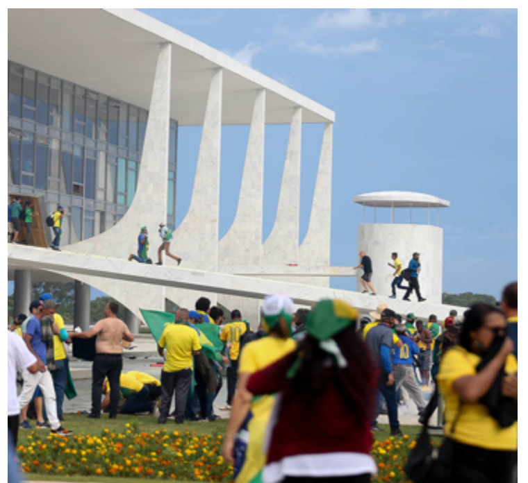
Justiça pode absolver dois acusados de atos golpistas