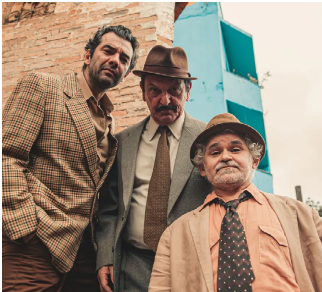
Joca e Mato Grosso foram feitos por Gustavo Machado e Gero Camilo, respectivamente

os preparativos uma espécie de glossário de "adonirês" para reproduzir a icônica fala errada do sambista.